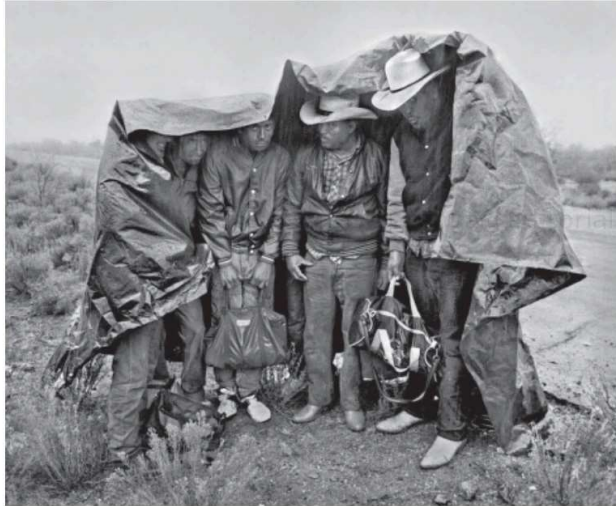
Un grup d'homens mexicans, deportats i enviats al desert.