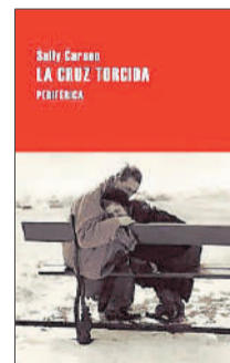
La cruz torcida Sally Carson Periférica 19,50 €