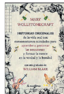
Historias originales de la vida real Mary Wollstonecraft La moderna editora. 22 €

El libro de instrucciones de Mary Wollstonecraft, pionera del feminismo, para convertir a niñas en futuras ciudadanas, por primera vez traducido al castellano gracias a La moderna editora. Estamos en la Inglaterra de finales del XVIII, pero estas historias plantean cuestiones de ética y filosofía de absoluta vigencia y ofrecen una preocupación por el trato a los animales y la convivencia con la naturaleza.