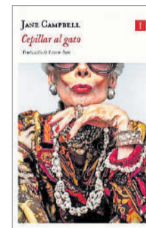
Cepillar el gato Jane Campbell Impedimenta 22,50 €