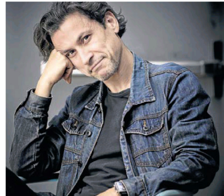
El director, actor y escritor Rodrigo Cortés.

el imprevisto éxito de ventas de este verano. Presentada como las ficticias memorias de un tal Jaime Fanjul Andueza, nacido en la Salamanca del 1902, la novela puede ser perfectamente definida como la ucrónica y disparata reinvención del siglo XX, pues ya desde la primera página alude a esos inicios de la pasada centuria como los del fantástico estreno del «reinado de Carlos VII, en el período de transición consensuada entre la IV y la V repúblicas». Los elementos surrealistas que ame-