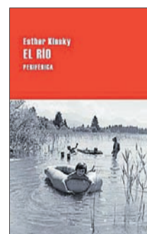
El río Esther Kinsky Periférica 22,50 €