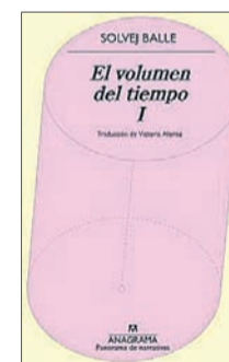
El volumen del tiempo I Solvej Balle Anagrama 18,90 €

Aunque las mujeres de la familia Aylward de Nenagh, en el condado irlandés de Tipperary, discuten a menudo y protagonizan alguna escena, su casa es un lugar de paz y un refugio de la tristeza y la crueldad del mundo. Bien lo sabe Eileen, repudiada por su familia tras quedarse embarazada y marcada por la muerte de su marido. Su hija, Saoirse, crecerá bajo su protección y la de su abuela paterna.