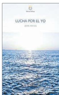
Lucha por el yo Joan Mayol EsPoesía 14,90 €