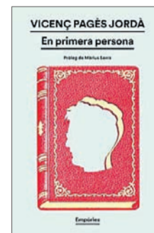
En primera persona Vicenç Pagès Jordà Empúries 18,50 €

El prolífico escritor catalán, galardonado con el Premi Nacional de Cultura, murió demasiado joven (58 años) en agosto de 2022. Desde 2018, trabajaba en un libro de narrativa breve que la muerte truncó. Afortunadamente, dejó una carpeta con un buen número de cuentos acabados y prácticamente ordenados que ven ahora la luz y que vuelven a asombrar por su imaginación, lucidez e ironía.