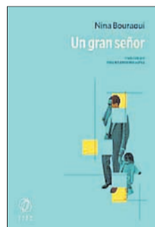
Un gran señor Nina Bouraoui Tránsito 19 €

Esta novela es la carta de amor y despedida de una mujer a su padre. Un relato que a veces es un ruego esperanzador y otras una travesía por la pérdida. Nina Bouraoui escribe desde el desgarró y el estupor que le provoca la inminente orfandad, y rememora su vida con emoción: su infancia en Argel, la llegada a París y el descubrimiento de su identidad sexual, la herida de los primeros amores o la escritura.