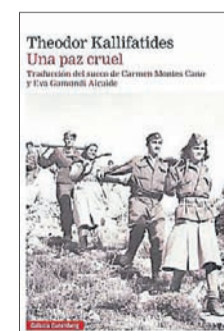
Una paz cruel Theodor Kallifatides Galaxia Gutenberg 19 €

En Una paz cruel , la guerra civil ha terminado. Los partisanos han sido aniquilados y ha llegado el momento de reeducar a los griegos en las viejas tradiciones, como cristianos y patriotas. La familia de Minos se ha mudado a Atenas. El padre no puede ejercer como maestro por su pasado socialista y la familia vive en la penuria, castigada también por los hermanos que participaron en la lucha antifascista.