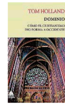
Portada de la primera edición española de «Dominio», que se publicó en 2021

las que se incluyen en los Evangelios. Alrededor de eso únicamente hay silencio. La pregunta que plantea es lógica, casi elemental: ¿cómo la cruz, un símbolo tan peyorativo en aquella sociedad, se