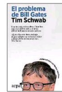
«El problema de Bill Gates» Tim Schwab ARPA 520 páginas, 24,90 euros

En este libro hay un doble camino. Uno es exterior y otro interior. El primero es el que trazan a lo largo del texto los protagonistas, y el otro, más personal, que se refiere a las mutaciones, transformaciones y evoluciones interiores de ellos mismos. La historia de una mujer responsable que un día necesita huir de todo lo que la ataba a su vida.