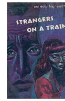
Portada de la primera edición de «Extraños en un tren», que se publicó en 1950

realidad es que el libro es una de esas novelas que sorprenden por su planteamiento sencillo y la complejidad psicológica que alcanza. El encuentro casual entre un hombre que desea separarse