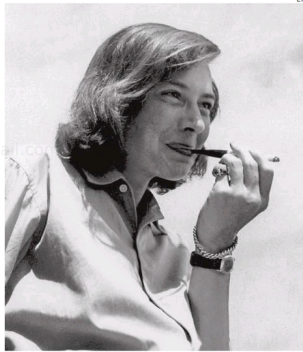
Patricia Highsmith, una escritora a la que le gustaban los caracoles y el silencio

Alfred Hitchcock, que siempre sabía lo que se hacía, no dudó en llevarla a la gran pantalla, aunque, para ser sinceros, ella siempre rechazó esa adaptación y nunca ocultó que no le había gustado. La