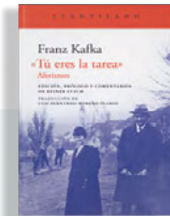
"Tú eres la tarea". Aforismos Franz Kafka Acentilado 256 páginas / 18€