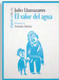
El valor del agua Julio Llamazares Nórdica 64 páginas / 18€