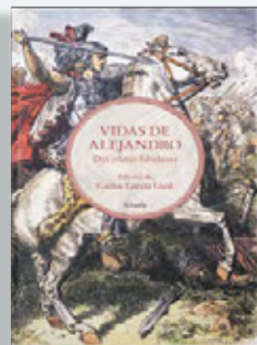
Vidas de Alejandro Pseudo Calístenes, Anónimo Siruela 412 páginas / 26€