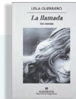
La llamada. Un retrato Leila Guerriero Anagrama 432 páginas / 20,90€

Cuando el artista irlandés Harry Clarke abordó hace ya más de un siglo, en 1917, la ilustración de estos Cuentos de imaginación y misterio , antología de algunos de los mejores relatos del escritor estadounidense, sentó cátedra ya para siempre en la obra del autor de Los crímenes de la Rue Morgue. El magnetismo que desprenden estas ilustraciones complementan a la perfección la hondura terrorífica que Poe transmitió con sus historias universales. Libros del Zorro Rojo ha decidido rescatar esta edición mítica, que aún lo es más si cabe al añadir la traducción al castellano realizada por otro grande de las letras en español, Julio Cortázar, que también firma el prefacio realizado en 1972. Una obra maestra total.