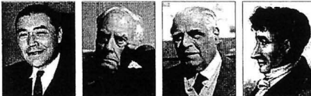
Josep Pla, Juan Perucho y Eugenio D'Ors han elogiado los aforismos del francés Joseph Joubert.