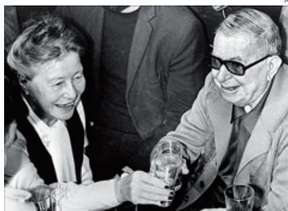
Sartre y Beauvoir mantuvieron a lo largo de 50 años una relación muy liberal.

Nada fue sencillo en la relación entre Jean-Paul Sartre (1905-1980) y Simone de Beauvoir (1908-1986), y nada está resultando sencillo en la biografía de la vida íntima de la pareja escrita por Hazel Rowley con el título Tête-à-tête: Simone de Beauvoir y Jean-Paul Sartre . Pese a haber sido un éxito por sus revelaciones sobre la relación entre ambos y sus numerosos amantes públicos y secretos, el libro, que ha contado con la ayuda de Sylvie Le Bon de Beauvoir, hija adoptiva de la autora, ha sido también protagonista de una polémica por las cartas utilizadas en la investigación. Por disposición de Arlette Elkaïm Sartre, hija adoptiva y ex amante del pensador, algunas de esas misivas, dirigidas a la amante de Sartre Lena Zoni-