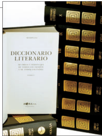
El diccionario literario, imprescindible para Borges.