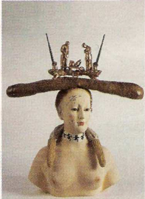
ARRIBA, «BUSTO DE MUJER RETROSPECTIVO», DE SALVADOR DALÍ. ABAJO, «LA REPRODUCCIÓN INTERDITE», DE MAGRITTE. AMBAS FORMAN PARTE DE LA EXPOSICIÓN DEL GUGGENHEIM.