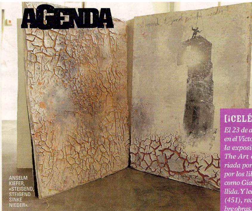
ANSELM KIEFER, «STEIGEND, STEIGEND, SINKE NIEDER».