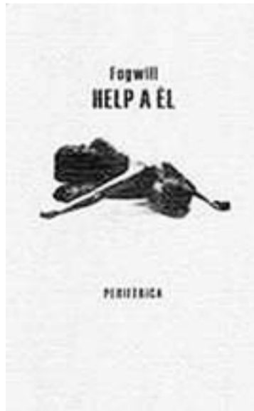
Portada del libro.

El libro de Periférica seleccionado contiene dos novelas cortas,