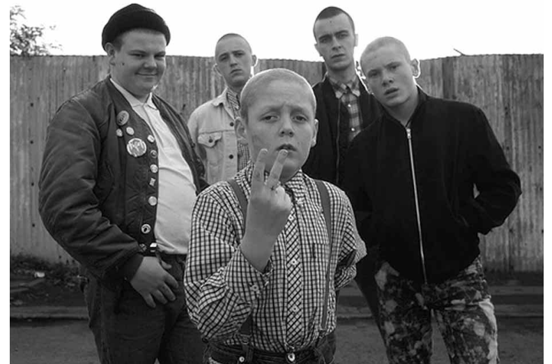
→ La pel·lícula ens revela l'origen mestís i antiracista del moviment 'skinhead'.

La baixa autoestima que li provoquen els comentaris sobre la seva indumentària i el pare difunt fan d'en Shaun un noi profundament trist. Fins que topa una colla de caps rapats que l'acull com el bufó d'una banda acostumada a passar l'estona fumant porros i escoltant la música sincopada provinent del Carib. En Shaun queda embadalit per aquest món: es rapa els cabells, descobreix el seu primer amor, es compra unes botes Dr. Martens i s'apunta a totes les festes que la seva colla celebra en pisos particulars.