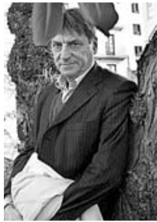
Claudio Magris.

Diré para terminar que el diseño de cubierta, con ese Heston imponente, riñe a brazo partido con el ensayo: por estética... y por ética.