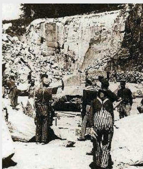
Un campo de concentración nazi.

Título: 'Fui hija de supervivientes del Holocausto'. Autor: Bernice Eisenstein. Editorial: Mondadori. Precio: 15,90 €. Lo mejor: Llama la atención el tratamiento de un tema tan trágico. Lo peor: Se echa en falta más profundidad.