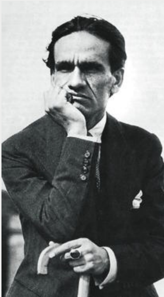
César Vallejo (Santiago de Chuco, Perú, 1892-París, 1938).