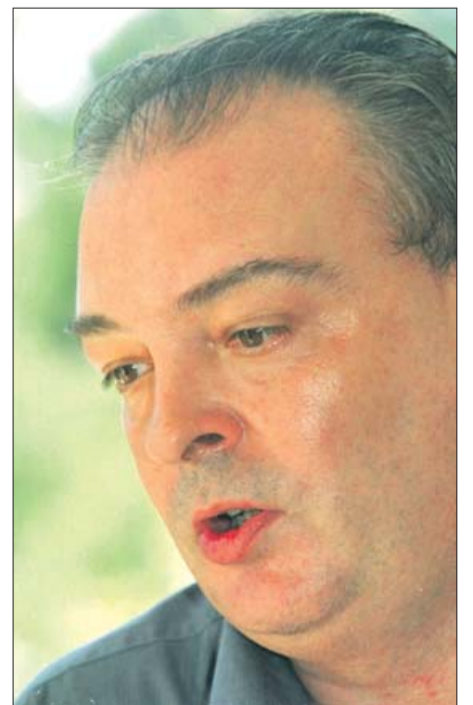
Enrique Vila-Matas, en una de sus visitas a Mallorca.