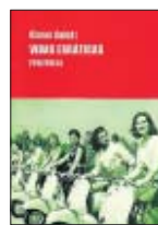
GIANNI CELATI Vidas erráticas

Las idioteces de la adolescencia son inconfundibles por lo demás (yo diría incluso que constituyen casi la esencia de la adolescencia) y cualquier persona honesta las reconocerá, a no ser que las haya perpetrado en la edad madura, en cuyo caso no tiene ya remedio y no le va a gustar este libro. Ni muchas otras cosas suculentas de la vida seguramente. Las idioteces tienen algo conmovedor y son necesarias, supongo, para crecer, porque como dice la sentencia bíblica: Ay de aquel que no haya hecho una idiotez en su vida (antecedente veterotestamentario del famoso dicho: no te fíes de los célibes ni de los abstemios). Tal vez el lector se identifique con algunas, pues son muy comunes, aunque también hay que decir que estas son las idioteces propias de hace dos generaciones, idioteces históricas por lo tanto, o idioteces dialécticas si me permiten la expresión; las de la adolescencia de hoy,