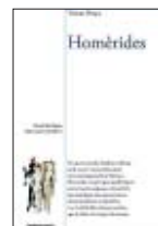
VICENT PENYA Homèrides

És, així mateix, dins l'estilística, on aquest poemari reforça el seu poder d'atracció en la dicció lírica. En primer lloc, per l'elegant construcció de la frase, que, potser, ens recorda l'enginy d'un Rois de Corella . Després, la gran riquesa lèxica, amb un vocabulari culte i exquisit, que no exclou la utilització sàvia de certs arcaïsmes que reforcen el bagatge literari del poeta.