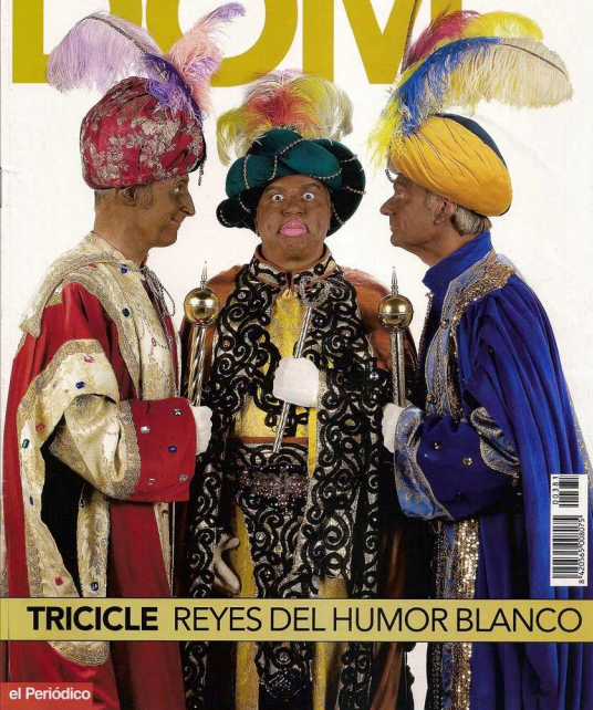
TRICICLE REYES DEL HUMOR BLANCO