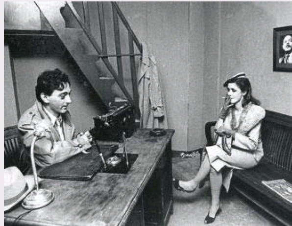
Un asesino en la lluvia sirvió de banco de pruebas para El sueño eterno , que llevó al cine Howard Hawks.

Armado con su sólido inglés de universitario culto y sin nada que perder, Chandler inició con Los chantajistas no matan su carrera de escritor policiaco, de escritor a secas, de escritor monumental. Ahora, RBA reúne en un solo volumen tamaño ladrillo todos los relatos escritos por el maestro estadounidense, los 25 cuentos que prefiguraron sus posteriores novelas. Hay pelirrojos imponentes y ambiguos, jugadores de ventaja, perdedores sonrientes, policías corruptos, políticos más corruptos aún, amigos náufragos que meten siempre en líos al protagonista incapaz de decir que no a un amigo por muy metepatas