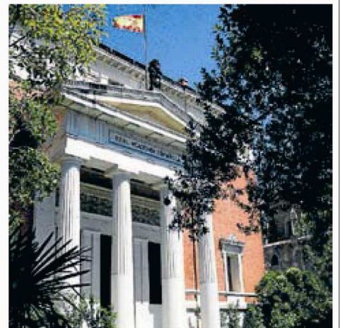
Fachada de la Real Academia Española. GRACIELA DEL RÍO

EL LIBRO DE TRAN PUEDE DESCARGARSE GRATIS (FRANCÉS) www.ego-commex.com