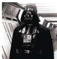
Darth Vader, el verdadero inventor del total black .