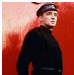
Oskar Werner, impecable uniforme en Fahrenheit 451 .