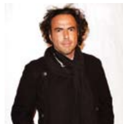
El director mexicano Iñárritu, con fular a juego.