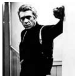
Steve McQueen, en Bullitt ; con pistolas y chulería.