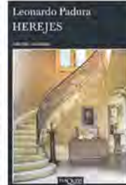
'HEREJES' Autor: Leonardo Padura. Estilo: Novela. Editorial: Tusquets. Barcelona 2013. 516 páginas. Precio: 21 euros.

Con todo, en la novela encontramos la esencia de la narrativa de Padura: el Conde y Tamara, el grupo de amigos, los libros de viejo, la novela que nunca se escribe, los trasiegos de ron, el desencanto isleño, el ansia irredenta de justicia y una desconexión con las nuevas corrientes juveniles cubanas. ¿Quién es el hereje aquí, el que se esconde del futuro o el que no se atreve a transitar por él?