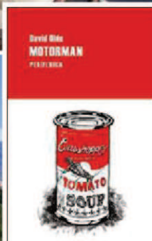
MOTORMAN de David Ohle (Periférica). Este autor de culto de los años setenta llenará de vorágine tus descansos.