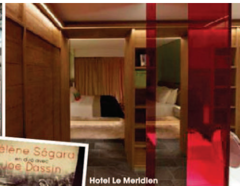
Hotel Le Meridien

EST SI TU N'EXISTAIS PAS (Sony Music). Hélène Ségara rinde un homenaje a Joe Dassin en este disco de duetos con el que revivirás temas mágicos.