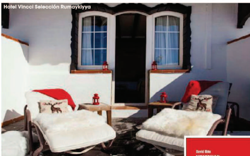
Hotel Vincci Selección Rumaykiyya