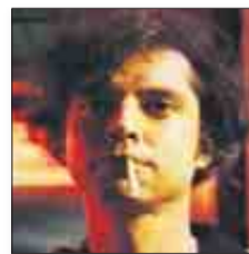
Joni B, PERIFÉRICA

► Se describen las neuras de diversos protagonistas cuasi adolescentes y definitivamente inmaduros, con un enfoque tan universal como paródico. La melancolía deja paso al delirio genérico y tan pronto encontramos a Supermán empleando su supervisión para ver desnudas a las chicas, como asistimos a una fiesta invadida por zombis, o viajamos a Marte sin traje espacial.