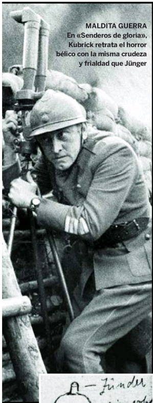
MALDITA GUERRA En «Senderos de gloria», Kubrick retrata el horror bélico con la misma crudeza y frialdad que Jünger

Rechazó el nacionalsocialismo casi desde el principio. De hecho, sus libros fueron quemados en la Alemania nazi y él exigió en más de una ocasión que dejaran de manipular su obra.