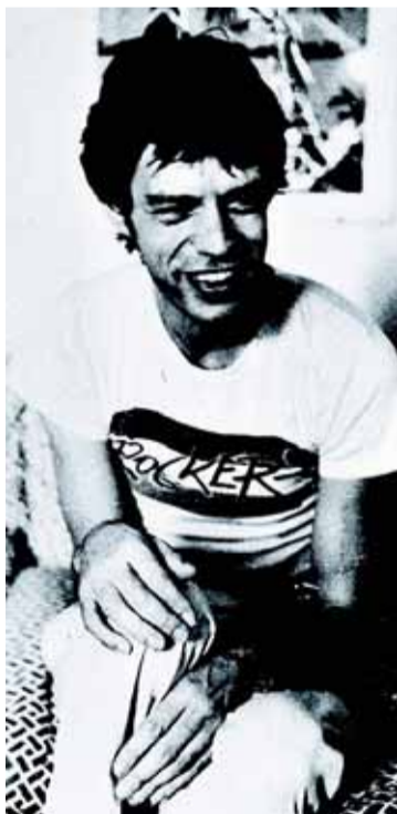
EN LA SELVA. Mike, en Iquitos.