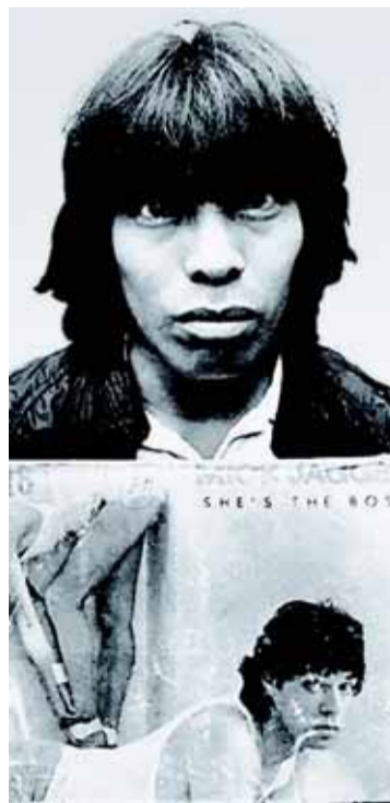
CONCURSO. El 'doble' de la selva peruana.

En una de sus visitas al poblado de Belén, el músico bebió cachaza junto a unos nativos chaucheros que no le dejaron pagar: «Es la pri-