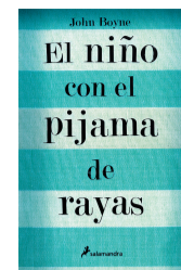
El niño con pijama de Rayas. J. Boyne.