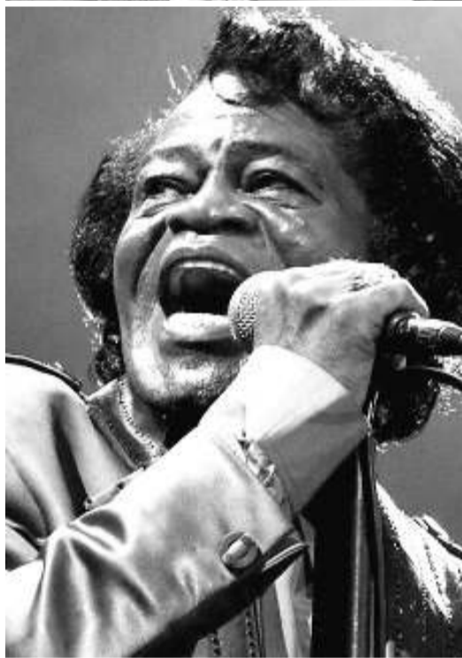
Beatles, Gainsbourg, Johnny Rotten i James Brown: un bon equip.

juvenils més primaris. Heylin analitza el Pepper des de la distància generacional, la qual cosa no vol dir amb desapassionament, i dona veu a uns quants personatges que van participar en la gestació del disc o van viure aquella època des de la primera línia de foc, des dels Beatles i George Martin fins a competidors com ara Brian Wilson i Pete Townshend. «Que Pepper és un disc molt valuós, he après ha acceptar-ho; que sigui considerat el millor àlbum de tots els temps em continua semblant francament ridícul», afirma l'autor en el