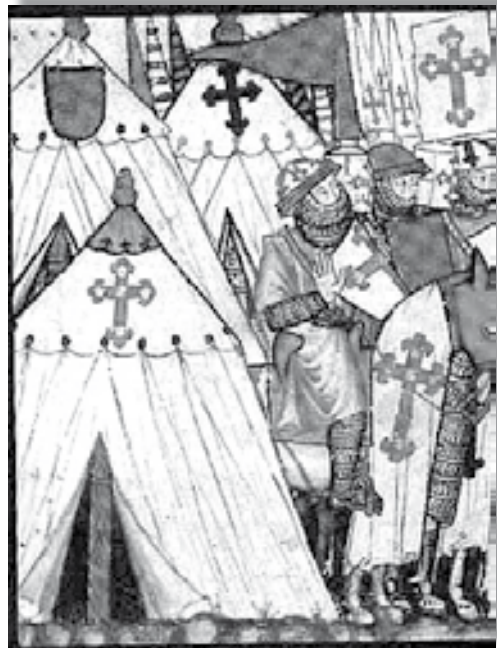
As cruzadas están na orixe da saga. EP

Blanco é tamén autora do volume para rapaces 'Os cen ollos do pavo real', publicada pola Editorial Everest dentro da colección Montaña Encantada. O conto está protagonizado por un pavo real que se enfrenta a todo un exército, impulsado pola amizade que o une ao novo Dalai Lama, que vive no Tíbet, un dos países máis belos do mundo.