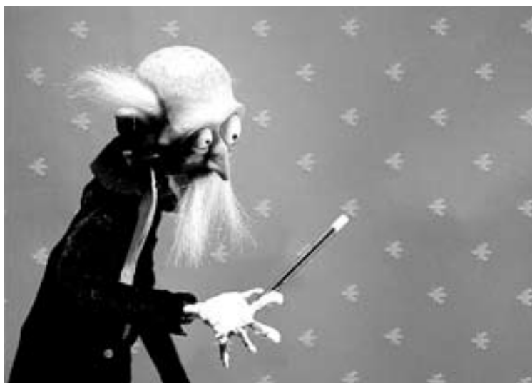
El 'Señor Ilusión' será una de las grandes novedades de la cita