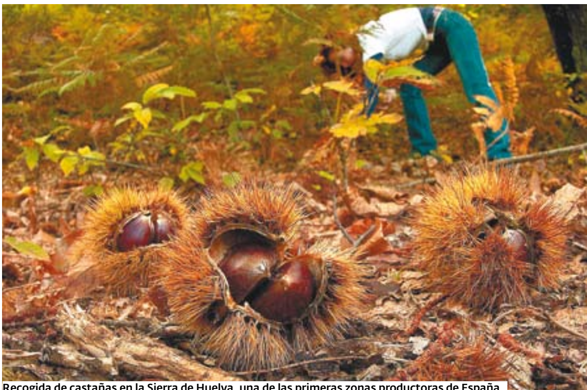
Recogida de castañas en la Sierra de Huelva, una de las primeras zonas productoras de España.

El magosto no es una fiesta urbana aunque se esfuercen algunos por llevarla a las plazas de la ciudad. Ni siquiera es una fiesta de la cocina de casa. El magosto pide celebrarlo al aire libre y a poder ser en pleno bosque. Hay que asar las castañas, que estallen una tras otra, en una hoguera en el bosque si es que lo tolera la afición de los gobiernos por regular, controlar y prohibirlo todo. El magosto en el bosque es un ritual de agradecimiento al alimento espontáneo que la naturaleza nos da. Es, lo recuerda Vicente Risco, una fiesta que nos vuelve