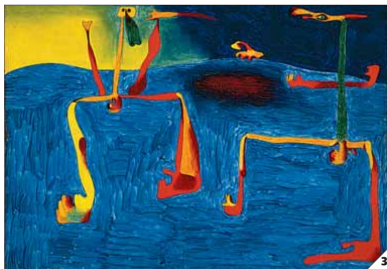
1. 'Interior holandès', a l'esquerra, és una de les obres exposades al MOMA ■ LARA BONILLA 2. 'Corda i personatges' (1935) inclou una corda real a la pintura 3. 'Els dos filòsofs' (1936) ■ SUCCESIÓ MIRÓ, 2008 / ARS, NOVA YORK / ADAGP, PARÍS

s'havia fet fins ara una mostra dedicada exclusivament a aquesta etapa de Miró.