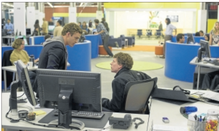
►► Un fotograma de 'La red social'.

Fincher construye una historia trepidante, en la que el personaje principal y los hechos que cuentan, se deslizan por la pantalla a un ritmo endiablado, lo que crea un ambiente de confusión que casa muy bien con el nacimiento y evolución de Facebook. Sin embargo, ese punto fuerte es al mismo tiempo la gran debilidad de una película que resulta a ratos tediosa para quienes no estén interesados en los entresijos de la red social por excelencia. Demasiado metraje además para la parte del litigio entre el que es considerado el creador de Facebook y los que le