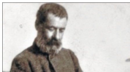
►► El escritor griego Alexandros Papadiamantis.

En la isla de Skiathos escribió a principios del siglo XX, la más recordada de sus novelas, La asesina , que ha publicado la editorial extremeña Periferérica. En un ambiente de miseria y desesperanza, el personaje femenino de Frangoyanú, de 60 años, traspasa en su conciencia el límite a partir del cual el crimen es un medio de curación social. Su razonamiento (que va y viene entre la lucidez y el delirio) es que ella