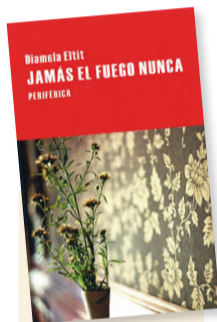
Jamás el fuego nunca Autor: Diamela Eltit Género: Novela Editorial: Periférica

Jamás el fuego nunca , décima novela Eltit, la cual se publicó en el año 2007 en Santiago de Chile. Volumen inconseguible en México: llega aquí distribuido por el sello español Periférica, después de los galardones recibidos por la autora: Premio Carlos Fuentes a la Creación Literaria en Español, 2020; Premio FIL de Literatura en Lenguas Romances, 2021. Los lectores inquirían por los libros de la enaltecida escritora que no estaban en los armarios de las librerías.