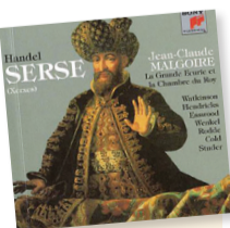
Jerjes / Händel Artista: Jean-Claude Malgoire Género: Ópera Sello: Sony

JERJES : la última ópera en tres actos de Georg Friedrich Händel para el prestigiado King's Theatre donde se presentó por primera vez en 1738. Pieza que no se volvió montar hasta el año 1924. / Cuenta la historia del anciano rey persa, Jerjes I, en la marcha bajo su mando en contra de Grecia. Montaje ficticio basado en referencias históricas (año 480 a. C.) sobre todo en la recreación del empeño de Jerjes de levantar un puente con botes para cruzar el Helesponto y así unir los dos continentes: Europa y Asia. Asimismo, la rara devoción del monarca por un plátano, desplegada musicalmente en el aria "Ombra mai fù", Platanus orientalis , que se haría famosa después en una versión más excitable, "Haendel's Largo".