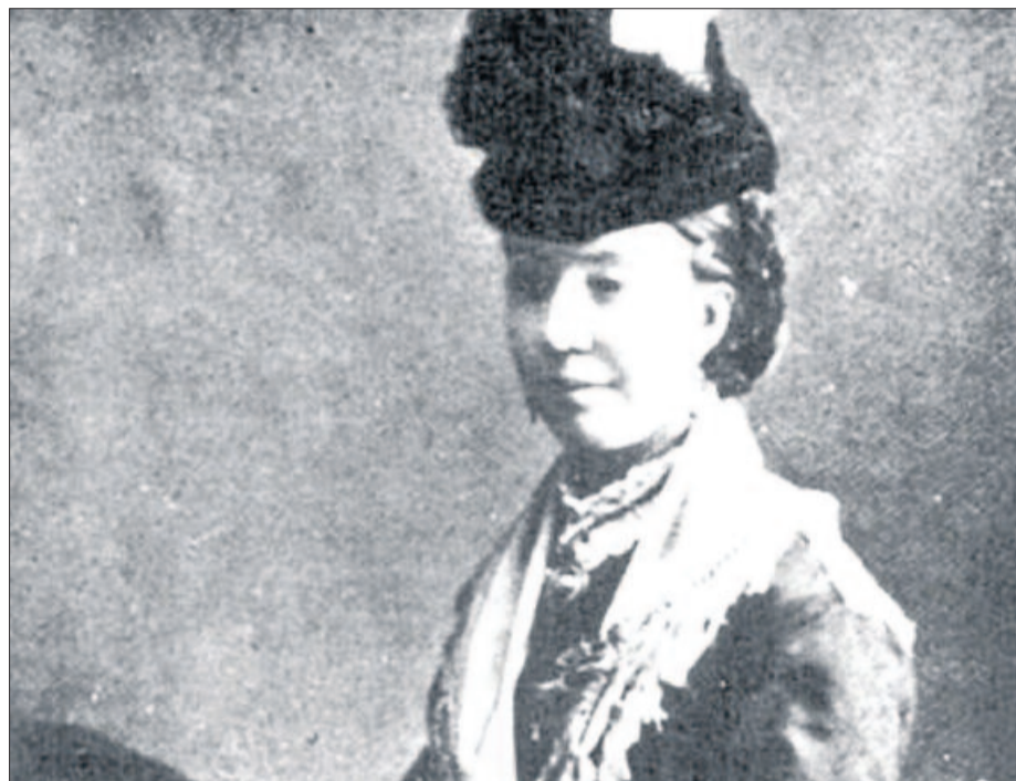
Única foto de Harriet Staunton, tomada en 1876. LA OPINIÓN

Ante las malas relaciones entre yerno y suegra, éste decide separarla totalmente de su familia y comienza a gastar su fortuna. Queda embarazada y para la recuperación decide enviarla al campo con su hermano y su cuñada donde vivían apartados y con pocos recursos, así mediante una mensualidad a su familiar directo se quitará el problema de en medio mientras se lleva