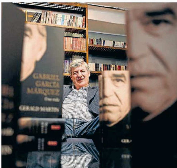
Martin dedicó 17 años de su vida a la figura del Premio Nobel de Literatura.

Quince películas competirán del 6 al 14 de noviembre para la Giraldillo de Oro del Festival de Sevilla, que dará su Premio de Honor al director español.