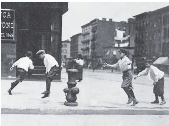
Imagen tomada en 1911 en Nueva York por el fotoperiodista americano Lewis Hine

Pues bien, el comentario de Wolfe encaja como un guante también en los dos títulos que el sello cacereño Periférica ha traído al español y que revelan a un