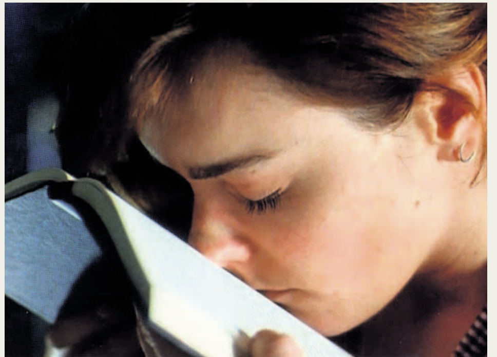
Una imagen de 'El milagro de la carne', de Javier Codesal.

'Cine y sentimiento' y 'Vislumbres de lo real' son los textos que acompañan a las películas. En el primero, con una escritura tan poéti-