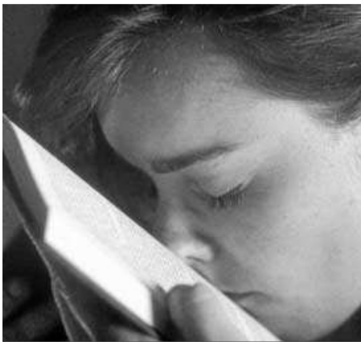
Una imagen de 'O milagre da carne' (1994), de Javier Codesal.

Prima aquí una concepción eminentemente materialista ("y rodar sin nada en la conciencia, con una pobreza que sólo se abastece del tiempo, como verdadero acontecer, y luz, como