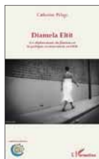
L'Harmattan también puso en línea una versión electrónica del estudio de Catherine Pélage.

Este año, la editorial española Periférica comenzará a publicar sus libros y el sello francés L'Harmattan acaba de presentar un estudio dedicado a su obra. La escritora chilena integra —junto a Cedomil Goic y Luis Rivano— el jurado del Premio Revista de Libros que esta semana dará a conocer al ganador.