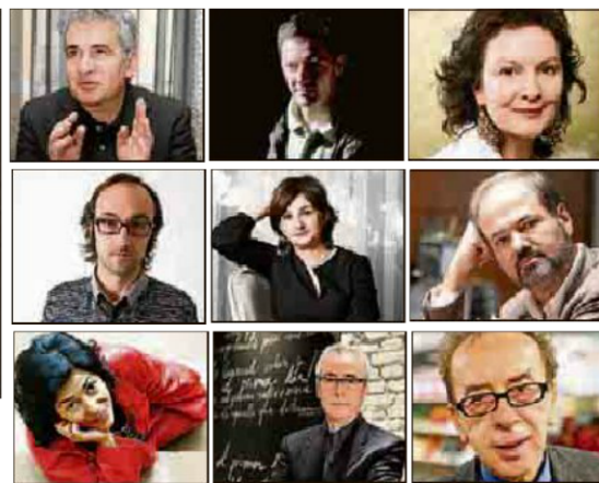
Poniatowska, Vila-Matas, Atxaga, Martínez Pisón, Sánchez, Fernández Mallo, Amoraga, Villoro, Grandes, Millás o Kadarés.