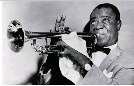
Louis Armstrong, un protagonista de lujo para esta excelente novela negra

Y, por fin, en «El lamento del mafioso», los tres personajes tratan de investigar un asesinato múltiple en el Nueva York de posguerra mientras el director del Copacabana busca dos millones de dólares. Los años del hundimiento de las grandes orquestas de swing obligan a Louis Armstrong a renovarse ante el empuje del bebop de Charlie Parker justo cuando el senador McCarthy empapa a los «diez de Hollywood»