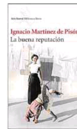
'LA BUENA REPUTACIÓN' Autor: Ignacio Martínez de Pisón. Estilo: Novela. Editorial: Seix Barral. Barcelona, 2014. 636 páginas. Precio: 21,9 euros