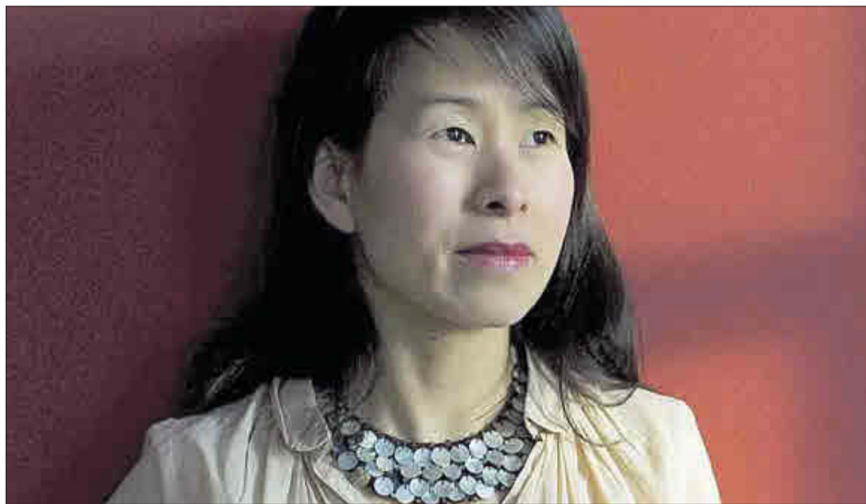
La escritora vietnamita Kim Thúy.

► Durante esas largas horas insomnes que pasan padre e hijo, deambulan por la ciudad, acuden a un club de jazz, atraviesan barrios poco recomendables, toman un barco para ir a una playa local, conocen a dos mujeres que los invitan a una fiesta bohemia, el chico vive su iniciación sexual, el padre le confiesa intimidades y secretos de los que jamás le había hablado...Y a lo largo de esos dos días y sus noches ambos comparten momentos inolvidables, que marcarán para siempre la vida del narrador.