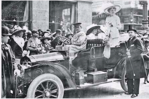
Una novela vienesa entrelaza discordias y rencores, bajo una magnífica prosa.