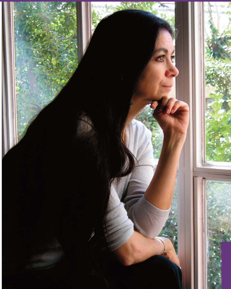
La escritora mexicana Carmen Boulosa.

La escritora Carmen Boulosa crea con El libro de Ana , publicado por la editorial Siruela , una novela curiosa e íntima en la que fabula con el entrañable personaje de Ana Karenina y al que, en cierta forma, intenta hacer justicia, dulcificando su trágico final. Si bien en la mente de todos los lectores aún pervive la dramática imagen de una Karenina a la que un amor inadecuado la llevó a descubrir el dolor y a sucumbir al repudio social.