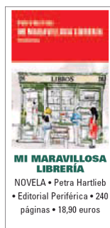
MI MARAVILLOSA LIBRERÍA NOVELA • Petra Hartlieb • Editorial Periférica • 240 páginas • 18,90 euros

Es el primero de la lista de los recomendados por los libreros españoles este mes. Por algo será.