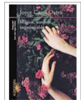
MÁGICO, SOMBRÍO, IMPENETRABLE RELATOS • Joyce Carol Oates • 440 páginas Alfaguara • 19,90 euros

Parricidio , el último relato de la serie, podría ser una novela por sí misma. La compleja relación de la hija de mediana edad y la jovencísima quinta compañera de un gran escritor (tal vez Saul Bellow) que ha ganado el Nobel, da un giro tras la muerte de este. Un hombre engreído y machista y dos mujeres de distintas generaciones que serán las portadoras de su memoria intelectual. Ironía y sarcasmo en la mejor Oates.