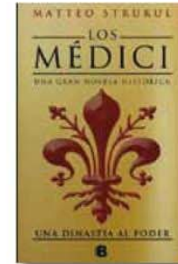
Los Médici Matteo Strukul Ediciones B • 20 €

Una exquisita novela que nos traslada a la Holanda del siglo XVII y que narra las peripecias de Catrijn, pobre e infelizmente casada, cuya vida da un vuelco cuando se queda viuda. Su vida tomará un nuevo rumbo, ya que decide dedicarse a lo que es su pasión: la decoración de cerámica. Se inicia así una aventura de superación personal plagada de arte, amor y misterio de la mano de una autora poco conocida en España, pero autora de éxito en su país.