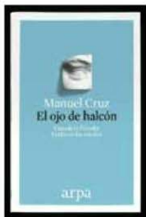
El ojo de halcón Manuel Cruz Arpa • 18,90 €

En este original ensayo, Manuel Cruz traza un personal retrato de la sociedad española y del mundo contemporáneo que no se apega a lo que se da por obvio, por sabido, ni a lo que dicta el sentido común, sino que se atreve a repensar los cánones, las normas y los paradigmas establecidos. Un retrato, en definitiva, que atraerá a los amantes de la filosofía y a todas aquellas personas que gustan de mirar con espíritu crítico cuanto les rodea.