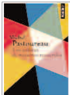
MICHEL PASTOUREAU Los colores de nuestros recuerdos ► Traducción de Laura Salas PERIFÉRICA

ejemplo, el color azul o amarillo, estará bien visto en la comunidad donde reine un régimen de derechas, por el contrario esos colores no serán admitidos en las comunidades del signo contrario más que nada por respeto a sus ideales y es que los colores los carga el diablo y más si se reflejan en eso que llaman bandera. Este autor como buen historiador del color pero ante todo historiador, hace un repaso por las humanidades y por cómo estas