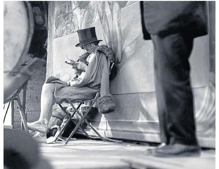
André Kertész hizo fotos desde 1915 a 1970 para 'Leer'.