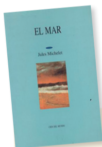
El mar Autor: Jules Michelet Género: Ensayo Editorial: Cultura, 2004

Uno entra a El mar y siente "el vestíbulo del Océano" que nos recibe con sus hervor-