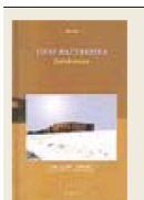
EZINBESTEAN Egilea: Unai Baztarrik. Género: Olerkiak. Argitaletxea: Erein. Orialdak: 72. Precio: 10 euro.

Poeta berrit bat, nahiko gaztea bestalde, eta lehiaketa inportante batean epaimahaiaren oniritzia jaso duena, datu hauekin aurreikus litekeena baieztatu da irakurketan: Poeta interesgarri bat agertzen zaigu idazlan honetan, poesian topikoak diruditen osagai batzuetan oinarrituta bere ahots propioa bilatzen ari dena.